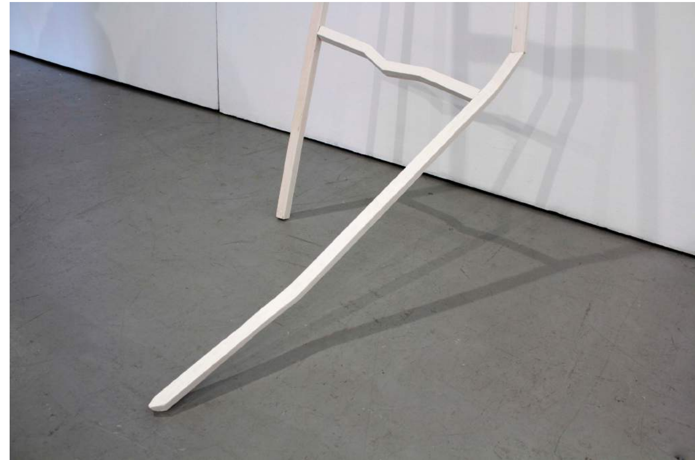
Sin título, 2021 Madera y gesso. 260 X 58 cm