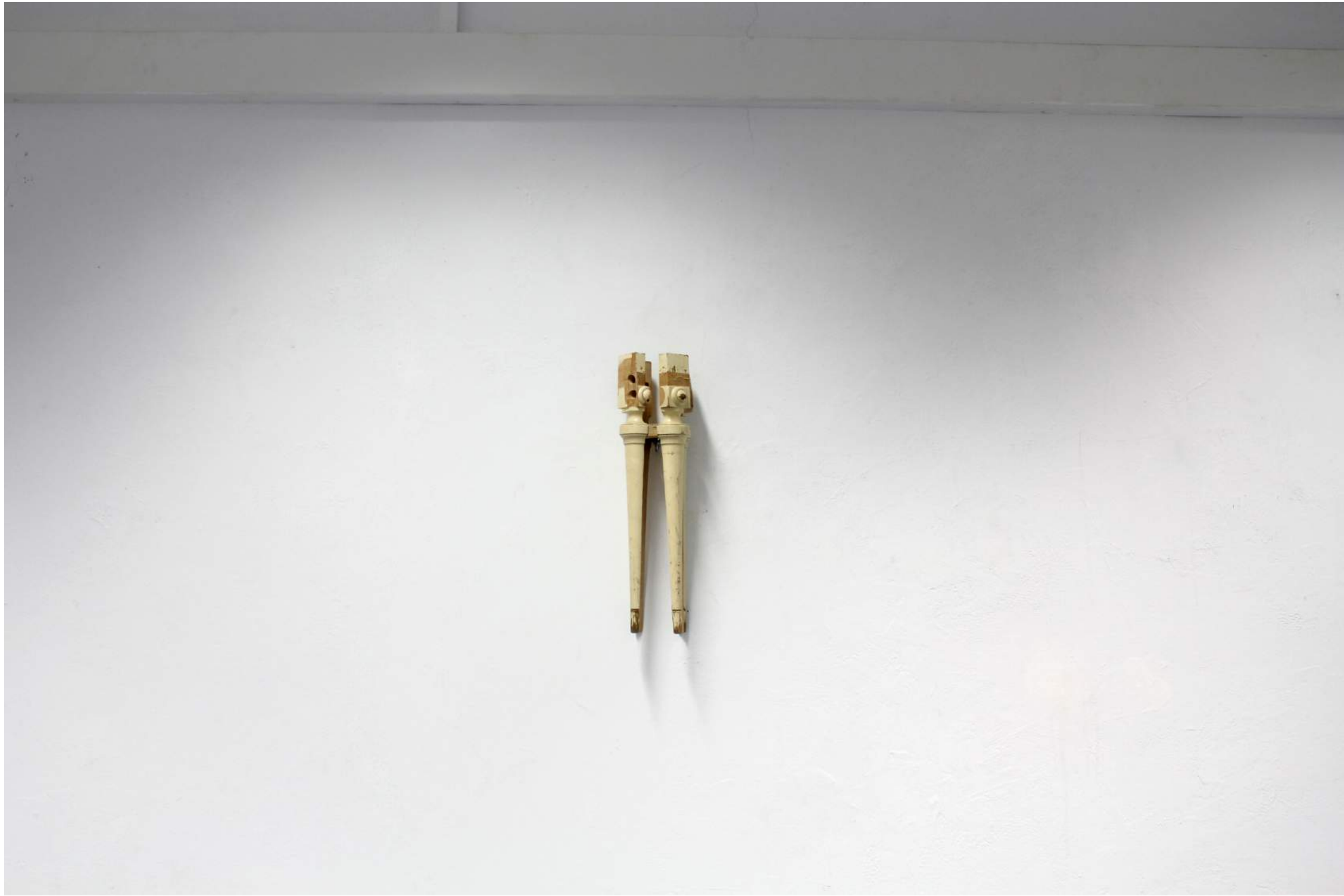
Sin Título, 2022. Madera 42 x 5 cm